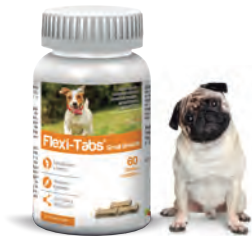
Flexi-Tabs® Small Breeds