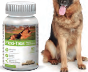
Flexi-Tabs® Medium & Large Breeds